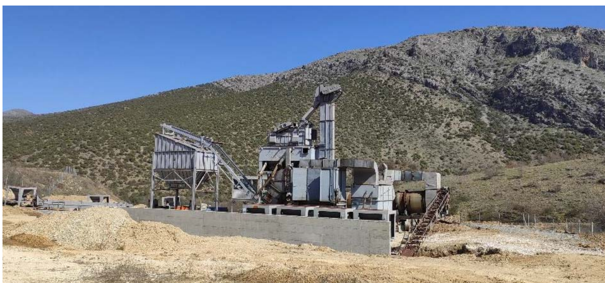
Слика 1: Локациска поставеност на Асфалтната база