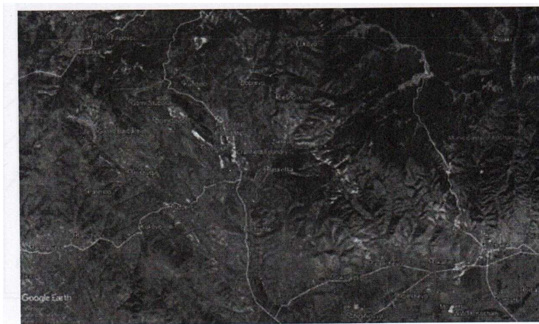
Слика 3 Сателитска снимка на Инсталацијата и поширокото опкружување