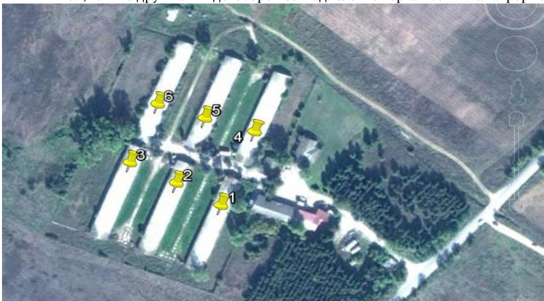
Мерни места на емисии

2.10.1 Операторот, согласно условите во Дозволата, ќе изведува мониторинг, ќе го анализира и развива истиот како што е опишано во документите наведени во Табела 2.10.1, или на друг начин договорен со Надлежниот орган во пишана форма.