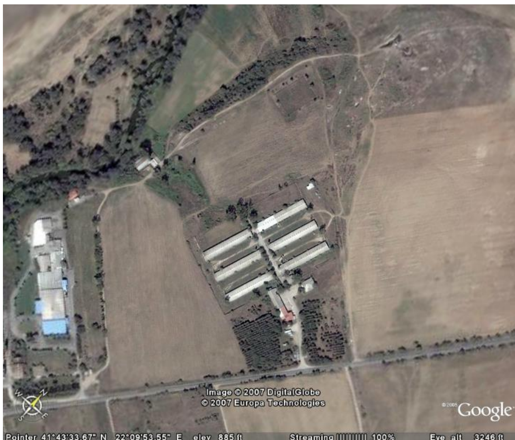
Местоположба на инсталацијата