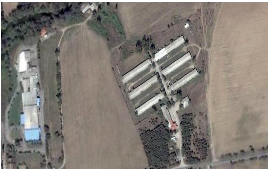
Живинарска фарма Живино-пром ДОО Штип