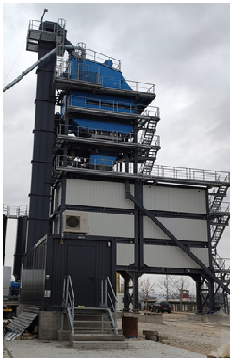
Елеватор, сито, бункери, контролна кабина - контејнер