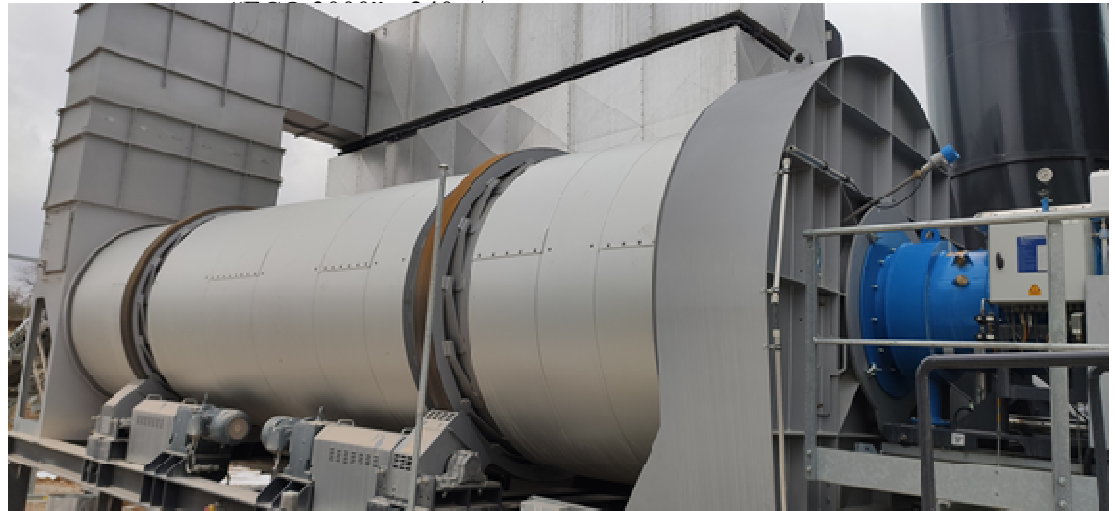
Ротациона печка - сушара