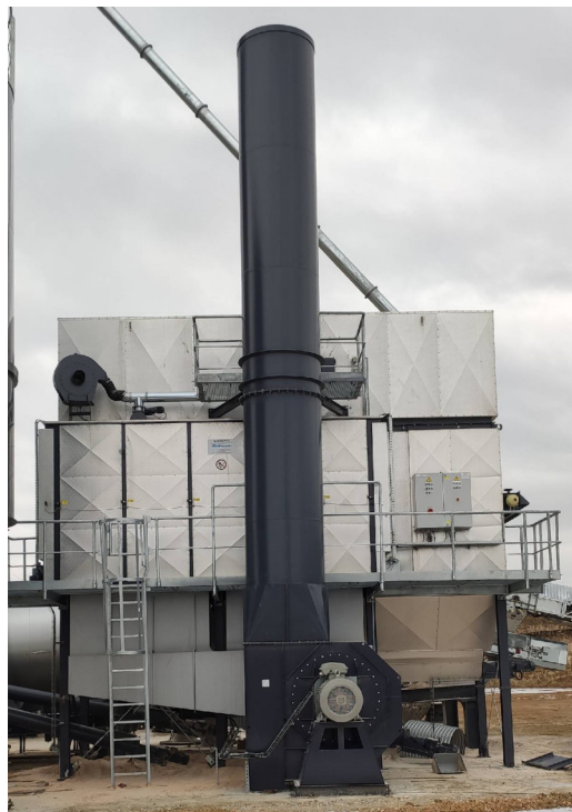
Филтер и оџак