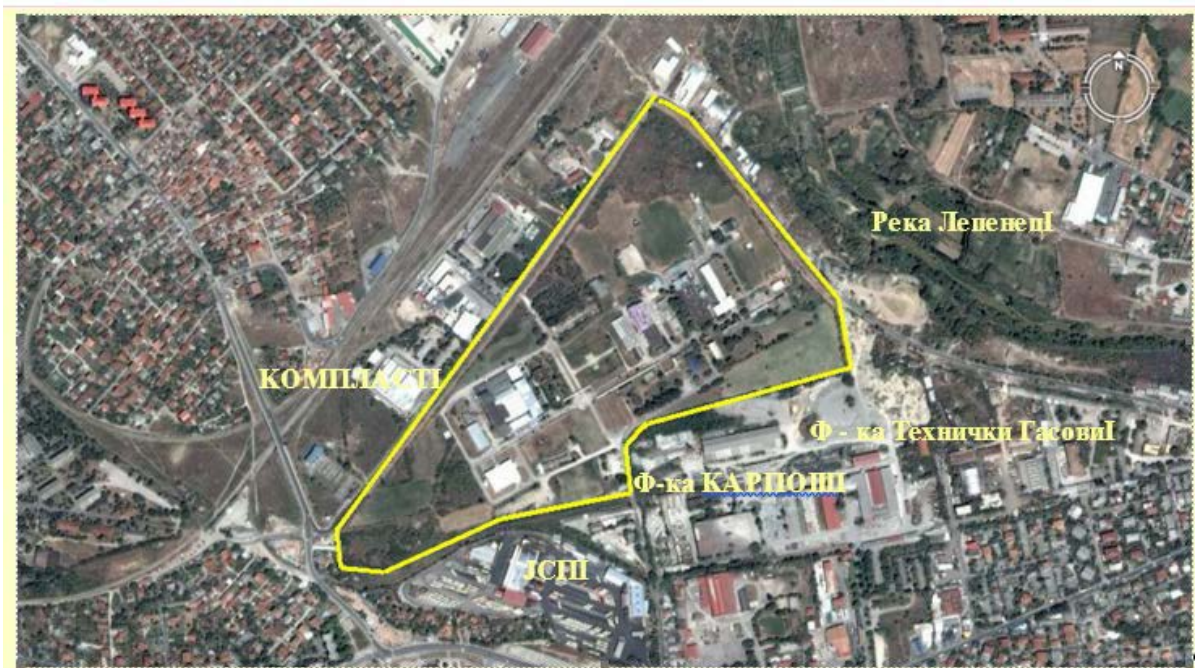
Мапа на микролокацијата Прилог I.2-2: Мапа на микролокација со географска положба и јасно назначени граници на инсталацијата (N 42,014301, E 21.366216)