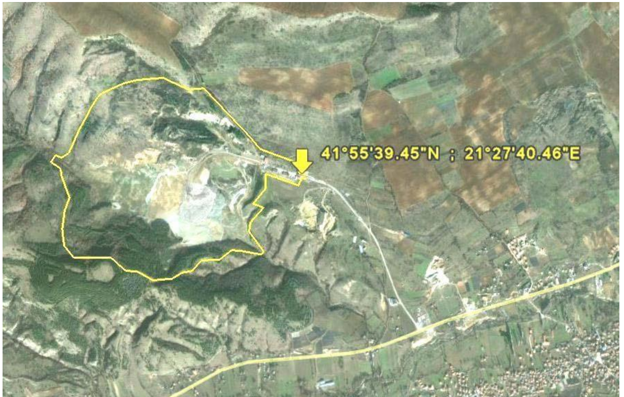
Слика бр. I-1 Локација на Депонијата Дрисла со обележени граници координати на влезот