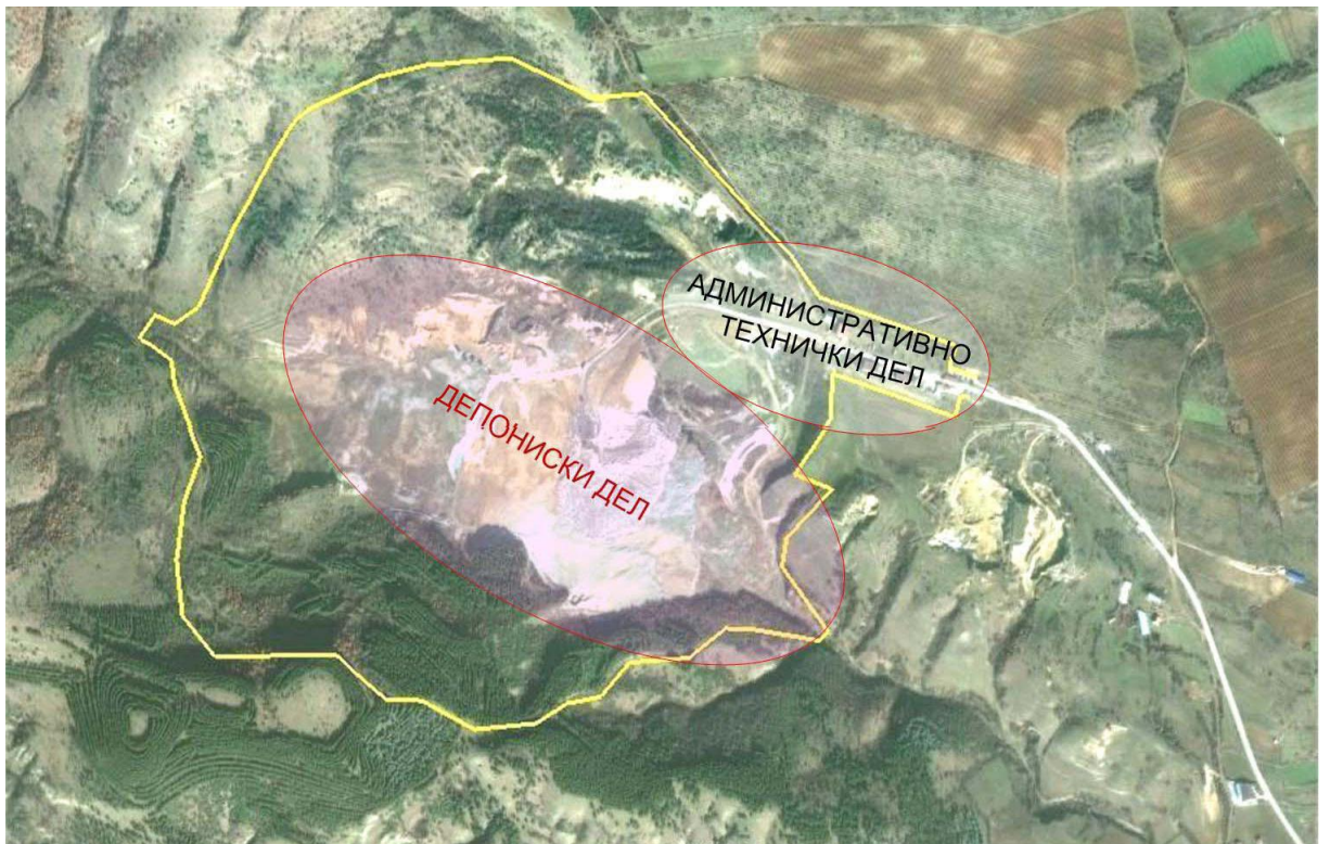
Слика бр. II-2 Дрисла со своите оперативни делови