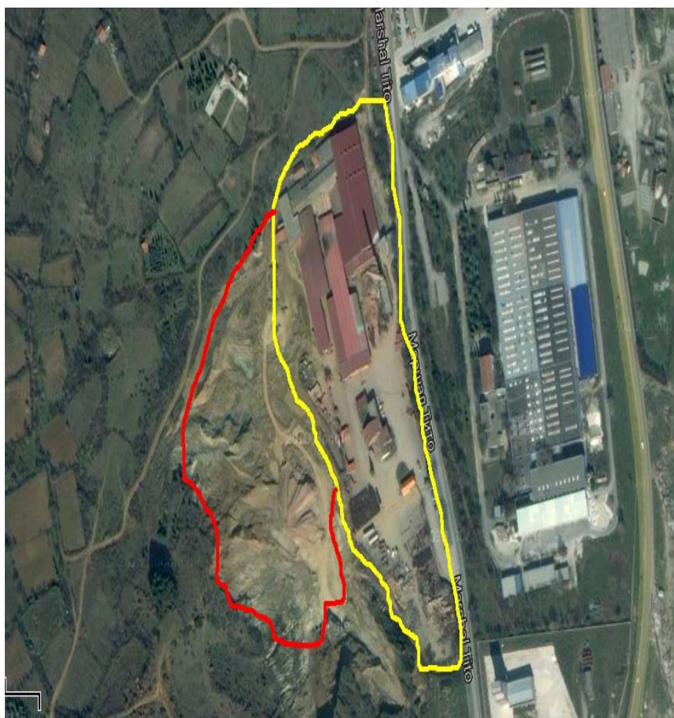
Слика 1. Мапа на локацијата со географска положба и јасно назначени граници на инсталацијата АД ИГМ “Еленица” - Струмица