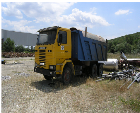
Сл 3. Цистерна

Товарна лопата со волумен на корпа од 2 м 3 и капацитет од 100м 3 /час, дизел вилушкар, цистерна за вода 20 т, четири камиони Volvo со носивост од 18 м 3 кои се набавени во 2009 год. Одржувањето на возилата и се врши во надворешни сервиси.