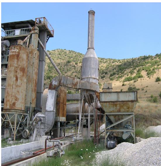
Сл. 10. Систем за прочистување

Камената прашина и испарувањата од мешалицата како и од сушарата и гасовите од согорување на мазутот (од бренирот) се зафаќаати водат во системот за прочистување кој се состои од циклон и воден филтер. Во циклонот се врши одстранување на крупните честички со паѓање на конусно дно. Честичките од конусното дно преку елеватор со кофички се упатуваат во силосите за филер. Гасовите се прочитуваат со поминување низ водениот филтер во кој се вградени прскалки со вкупно 18 дизни за распрснување на вода. На слика 10 прикажан е системот за прочистување.