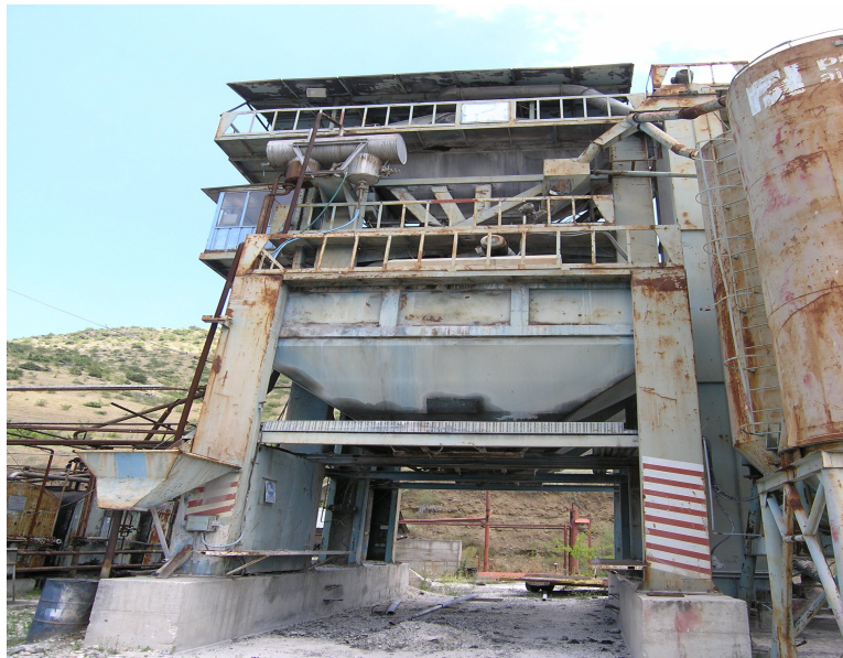
Слика 9. Складирање и товарење на асфалт

Како што е прикажано на слика 9 силосите за готов асфалт се наоѓаат на висина од околу 3,5 м заради можноста испод силосот да застане камион во кој се врши товарење. Дното на силосот е со хидрауличен отворач кој се отвора со притискање на копче кога камионот ќе биде во позиција под самиот силос. По испување на асфалтот во камионот хидрауличната врата се затвора со што завршува циклусот на производство на асфалтот. Од командната кабина со рачна команда се управува со пневматскиот систем од постројка за производство на асфалт.