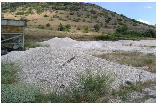
Сл.5 Отворен склад

Минералната, варовничка, суровина одложена на отворен склад (сл 5.) со лопатата од товарната машина, зависно од гранулацијата, се додава во еден од 5-те дозирни бункери за сепариран варовник. Сепарираниот варовник од 0-4 мм се складира во два бункери а додека сепарираниот варовник од 4-8 мм, 8-11 мм, 11-16 мм се складираат во останатите три дозирни бункери. Филер-микронизирианиот варовник се складира во два силоси од по 10 м 3 .