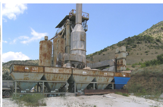
Сл.6 Бункери за минерална суровина

Од дозирните бункери прикажани на слика 2. преку уреди за дозирање - вибродозерки минералниот агрегат во одредени количини паѓа на заедничка собирна транспортна трака. и се пренесува до вибрациониот додавач, низ кој во рамномерна количина се дозира, проаѓа, во ротациониот барабан од сушарата која е прикажана на сл. 7 и 7а.