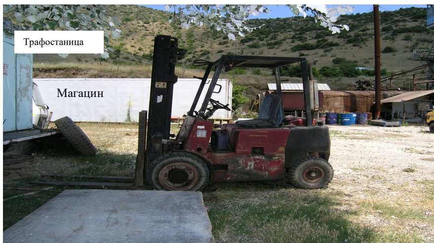
Сл.1 Дел од помошните објекти на асфалтната база

За потребите на петте вработени поставен е и полски тоалет кој се празни од страна на ЈКП СЦГ. Широкото дворно место се користи за складирање на минералната сировина, паркирање и движење на транспортни возила. (камиони), лесни возила и останатата механизација. Манипулативните површини и пристапниот пат овозможуваат лесен пристап и движење на возилата.