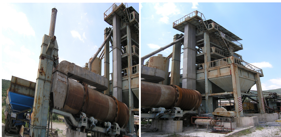
Сл.7.и 7а . Дел од постројката за асфалт со сушара

Од дозирните бункери прикажани на слика 2. преку уреди за дозирање - вибродозерки минералниот агрегат во одредени количини паѓа на заедничка собирна транспортна трака. и се пренесува до вибрациониот додавач, низ кој во рамномерна количина се дозира, проаѓа, во ротациониот барабан од сушарата која е прикажана на сл. 7 и 7а.