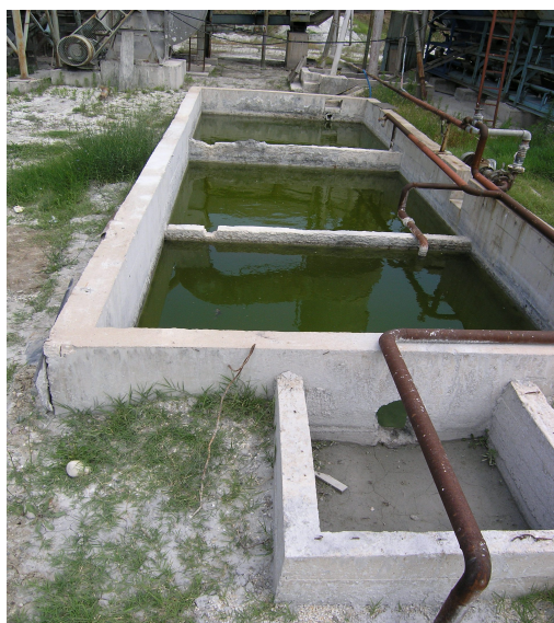
Сл. 10а. Трокоморен таложник

Прочистените гасови по поминување низ водена завеса преку оцак се испуштаат во атмосферата. Апсорбираните гасови и ситните микронски честички со водата се вливаат во трокоморен таложник прикажан на слика 10а.