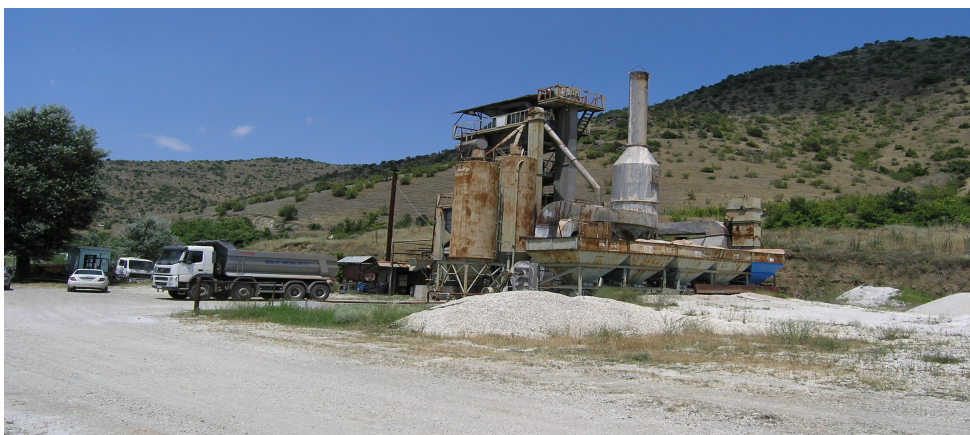
Слика 2. Асфалтна постројка

Асфалтната постројка од Италијанско производство тип S.I.M е прикажана на ситуацијоната карта дадена во прилог бр. 5 и сл. 2. На прилог бр. 2 е даден договор за закуп на постројката за производство на асфалт на неопределен рок. Произведена е во 1982 година и со моќност од 230 KW.