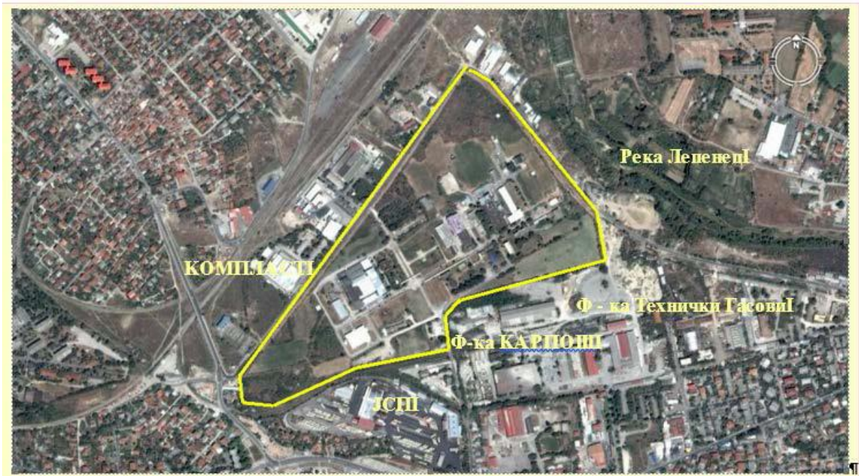
Мапа на микролокацијата Прилог I.2-2: Мапа на микролокација со географска положба и јасно назначени граници на инсталацијата (N 42,014301, E 21.366216)