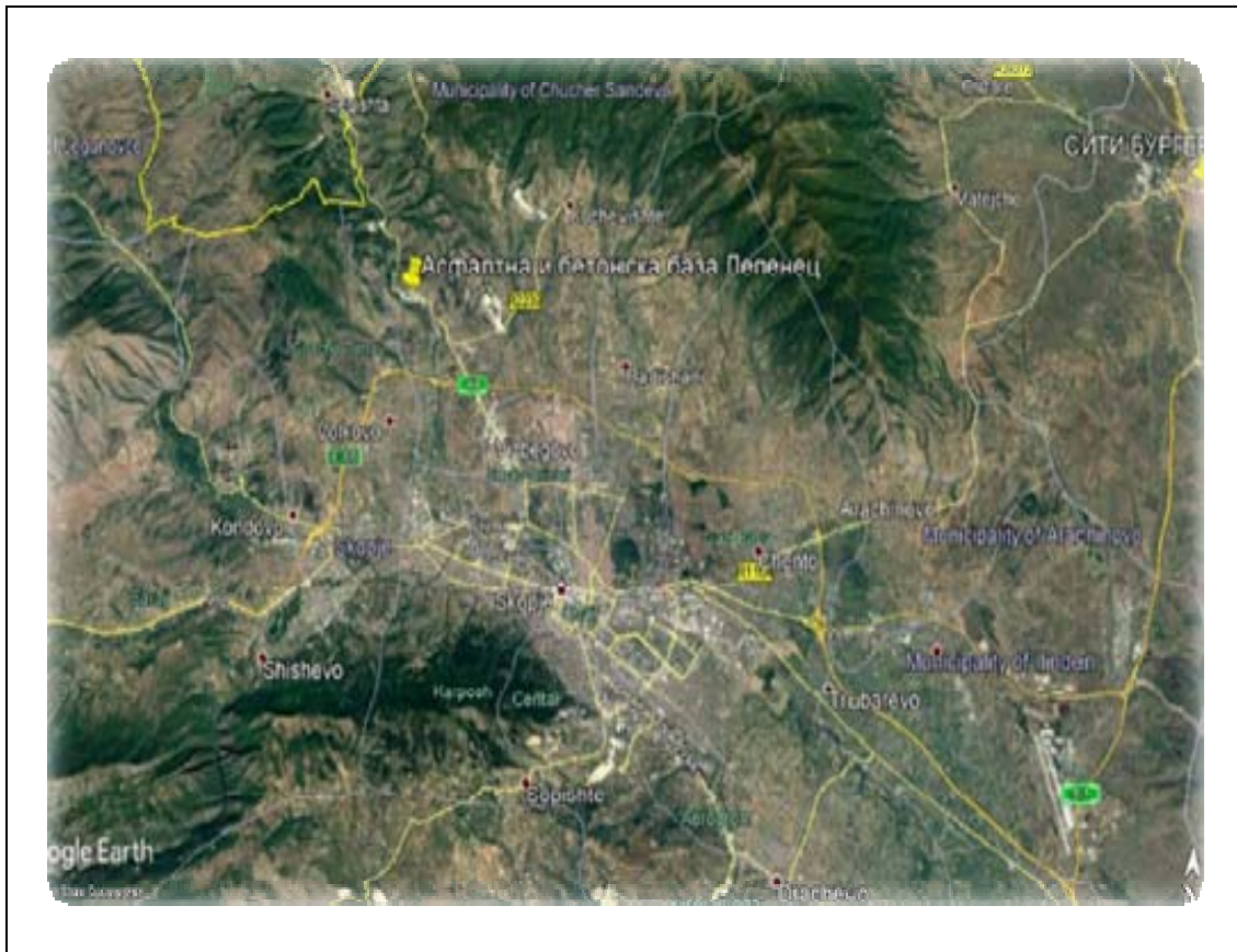
Слика 2. Мапа на локацијата со географска положба и јасно назначени граници на инсталацијата

06.08.1 Инсталацијата ќе работи, ќе се контролира, ќе одржува и емисиите ќе бидат такви како што е наведено во оваа Дозвола. Сите програми кои треба да се изготват според условите во оваа Дозвола стануваат дел од Дозволата.