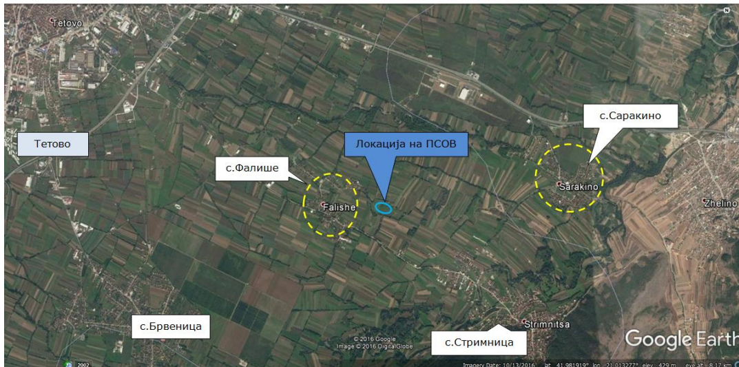
Слика 2 Положба на ПСОВ Тетово и опкружување

Локацијата на пречистителната станица за отпадни води ги опфаќа КП 118, КП 119, КП 120 и КП 212 во целост, како и дел од КП 585, КО Фалише, м.в. Горна Режика, село Фалиш, на територија на општина Тетово.