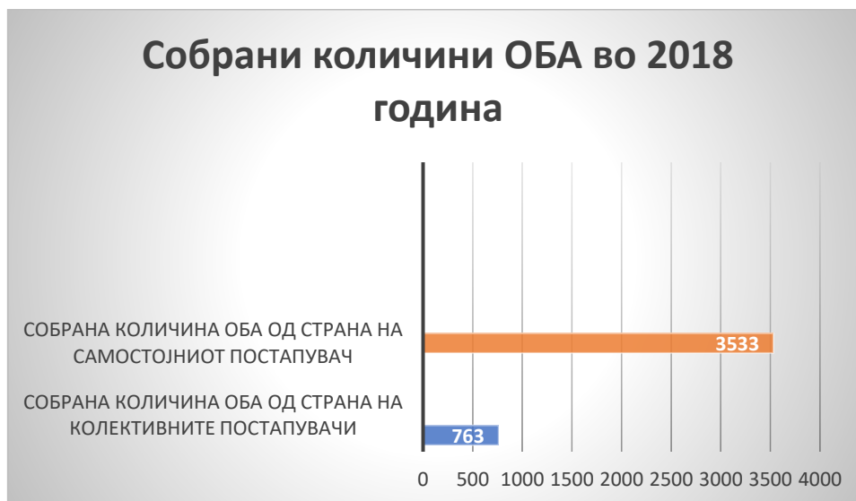
Слика 4. Собарана количина ОБА во Република Северна Македонија во 2018 година