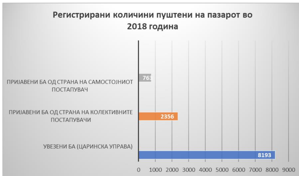
Слика 3. Количини БА пуштени на пазарот во Република Северна Македонија во 2018 година