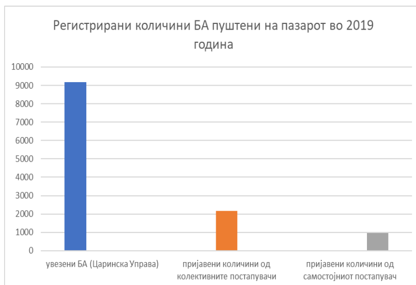
Слика 1. Количини БА пуштени на пазарот во Република Северна Македонија во 2019 година