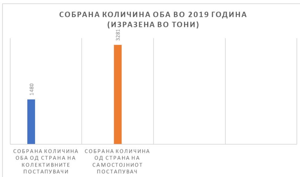
Слика 2. Собарана количина ОБА во Република Северна Македонија во 2019 година