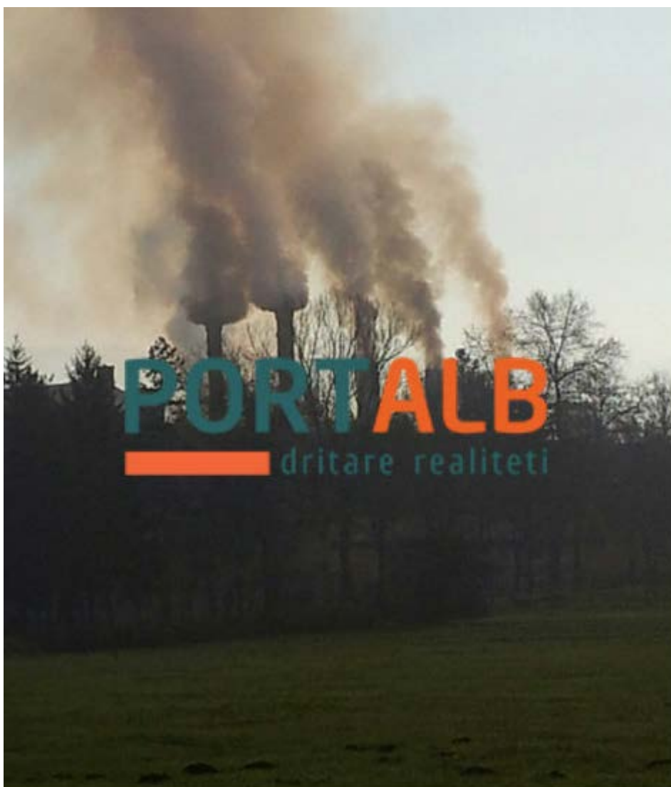
Fabrika e Jugohromit