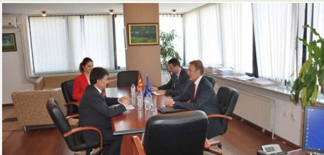
Ministri Izari priti ambasadorin e Bashkimit Evropian, Aivo Orav