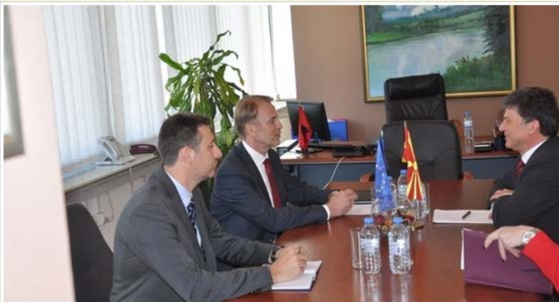
Ministri Izari priti ambasadorin e Bashkimit Evropian, Aivo Orav

Me këtë rast, gjatë bisedës, një theks i veçant iu vu problematikës së ndotjes së ajrit dhe Zmadho fotografinë