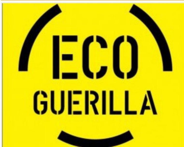
Lëvizja Eco Guerilla