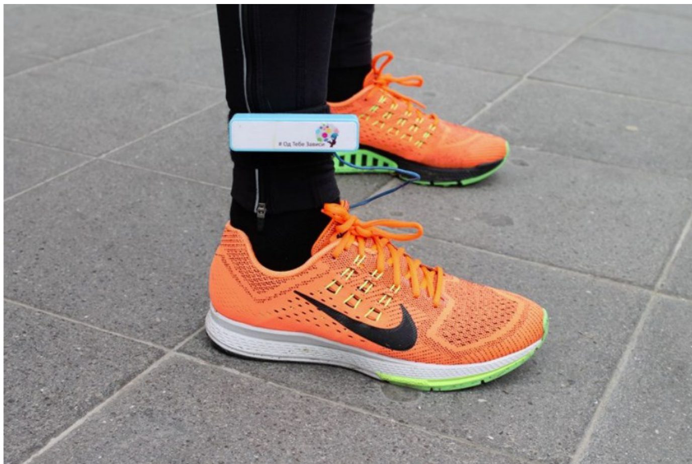
ФОТО: Македонија го доби првиот прототип на паметни влошки кои произведуваат електрична енергија