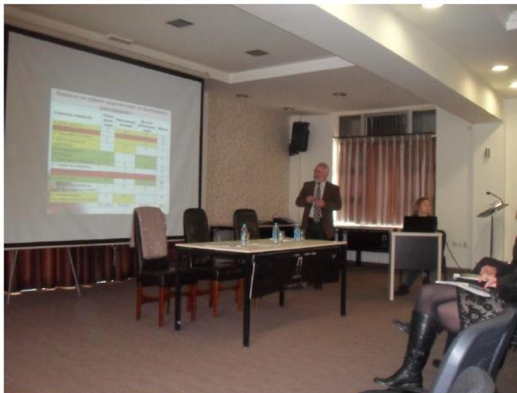
Слика 2 Презентација на Националната Стратегија за биолошка разновидност со акциски план

спроведените активности за изработка на нацрт НСБРАП, како и процесот на вклучување на засегнатите страни (организација на повеќе работилници и состаноци) при нејзината изработка.