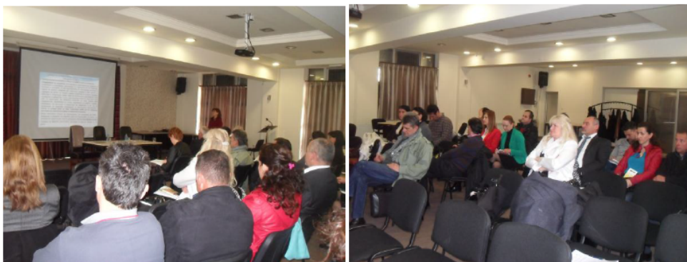
Слика 5 Засегната јавност