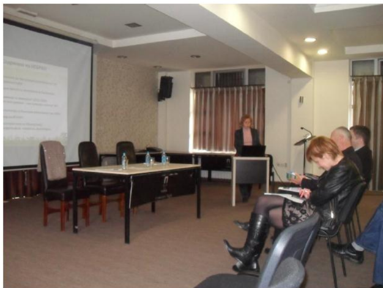
Слика 3 Презентација на Националната Стратегија за биолошка разновидност со акциски план

Записник од јавна расправа по Нацрт Извештајот за стратесиска оцена на животната средина за Национална стратегија за биолошка разновидност со акциски план