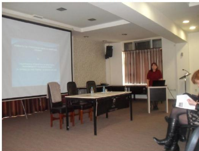
Слика 4 Презентација на Извештајот за Стратешиска оцена на животната средина

Беше потенцирано дека нацрт Извештајот за СОЖС е објавен на веб страната на МЖСПП на 20.03.2015 година и е достапен за јавен увид во период од 30 дена од денот на објавување. Во овој период засегнатата јавност може ги доставува своите забелешки, мислења и сугестии. Истите ќе бидат вградени во финалната верзија на Извештајот за СОЖС.