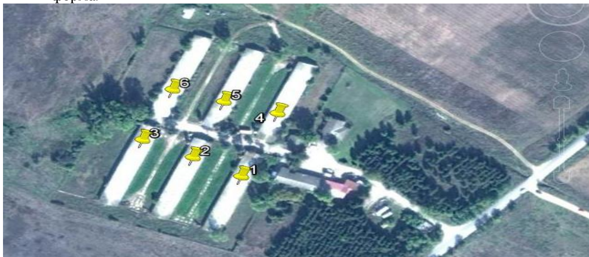
Мерни места на емисии

2.10.1 Операторот, согласно условите во Дозволата, ќе изведува мониторинг, ќе го анализира и развива истиот како што е опишано во документите наведени во Табела 2.10.1, или на друг начин договорен со Надлежниот орган во пишана форма.