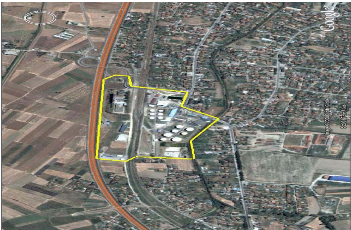
Мапа на локацијата со географска положба и јасно назначени граници на инсталацијата

Министерство за животна средина и просторно планирање