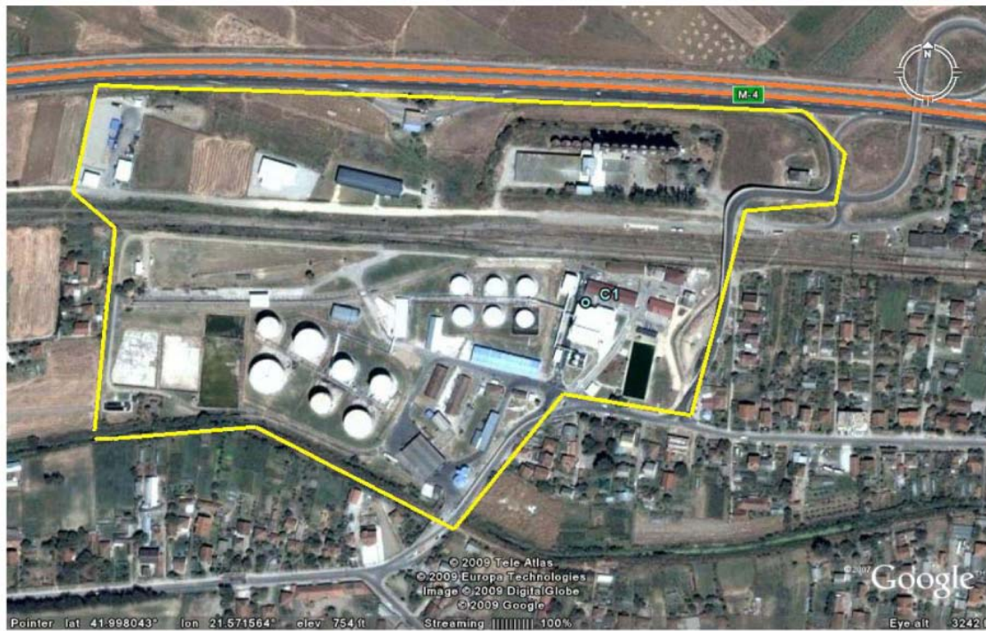
Распоред на мерното место за отпадна вода