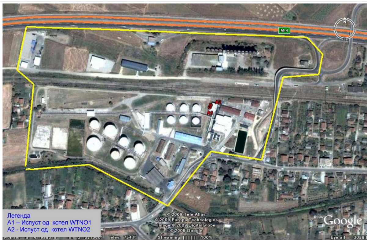
Распоред на мерни места на емисии во воздух

Министерство за животна средина и просторно планирање