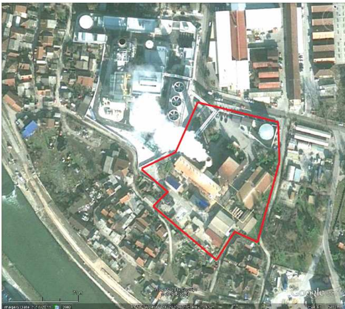
Местоположба на инсталацијата