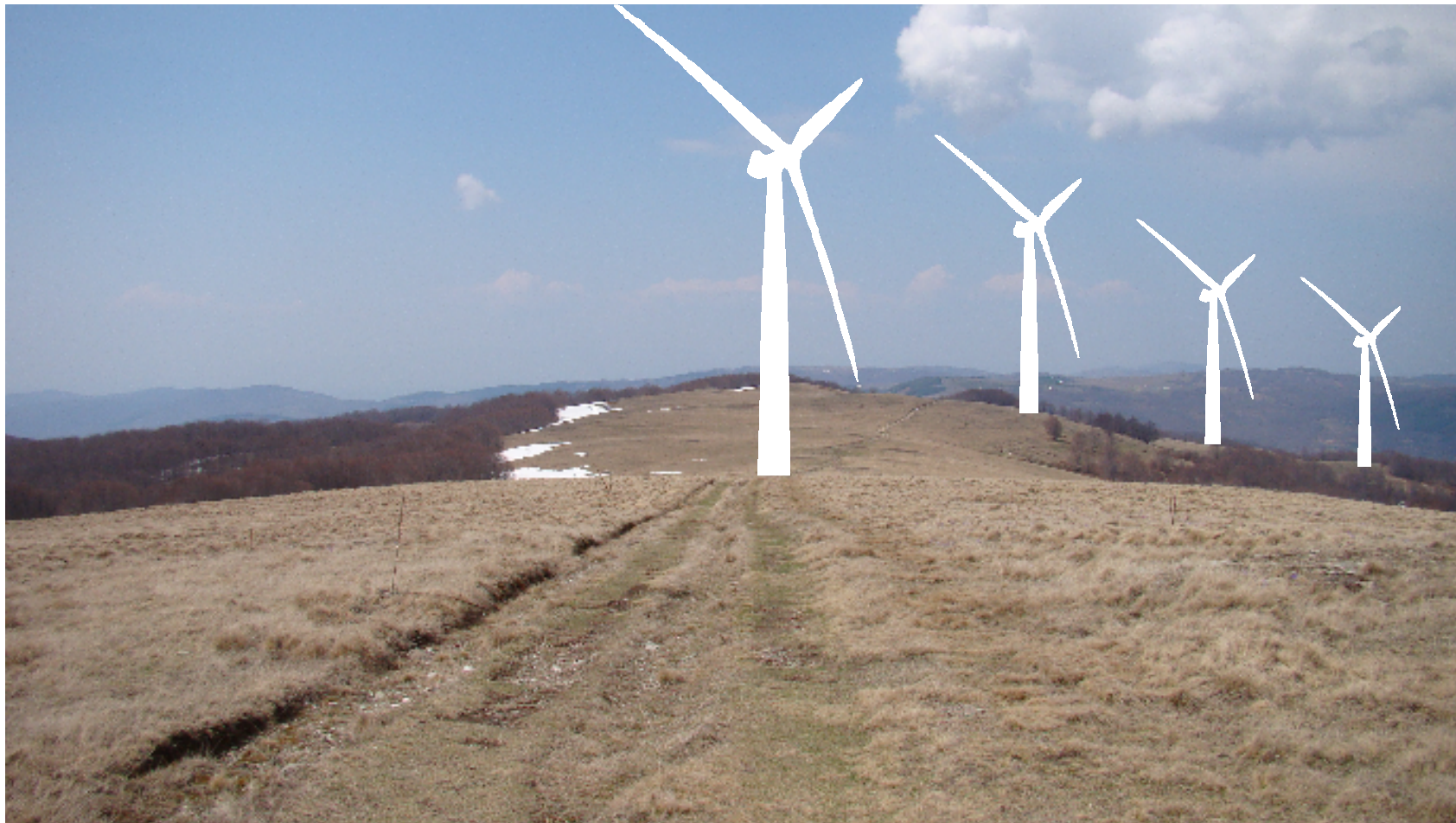
Монтажа: Поглед кон турбинска секција на локалитет Голем Чукар