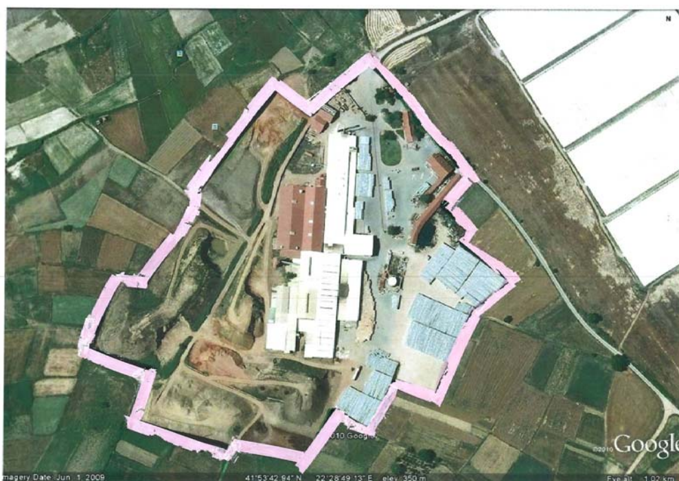
Слика 1. Мапа на локацијата со географска положба и јасно назначени граници на инсталацијата “Тондах” МАКЕДОНИЈА А.Д. Веница