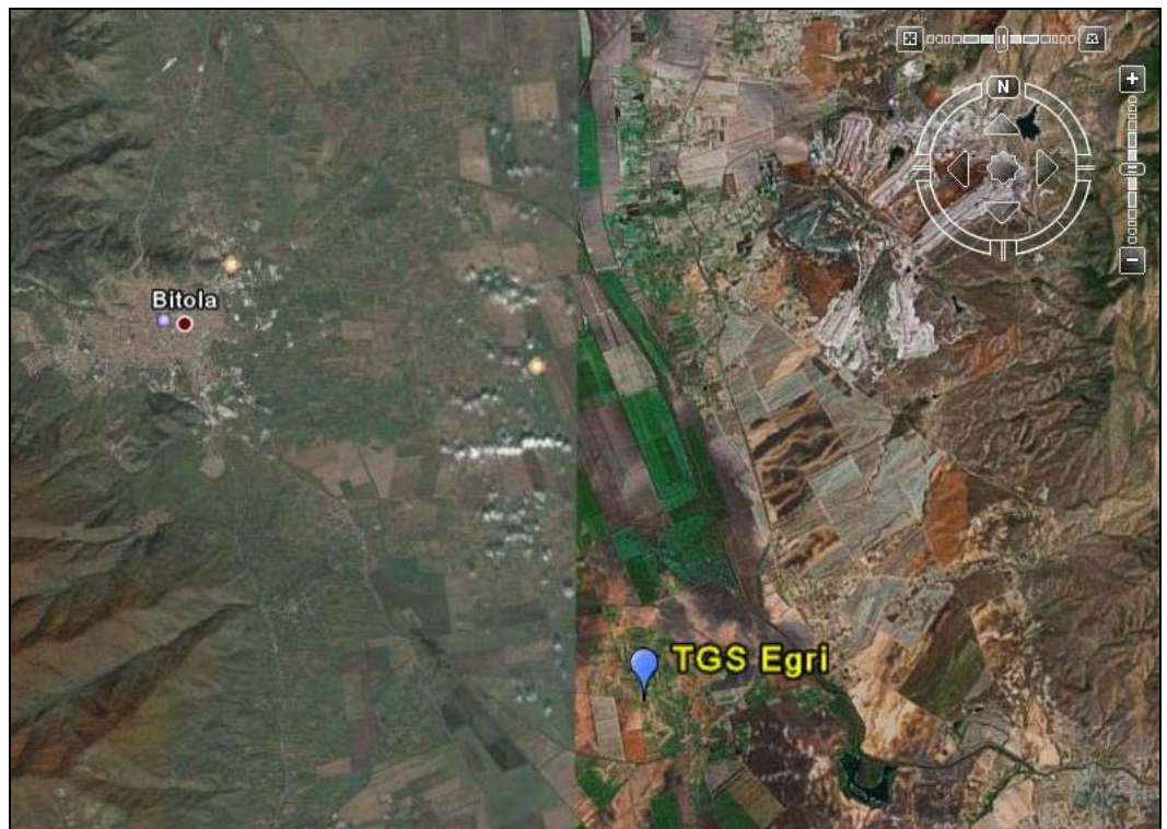
Мапа на границите на инсталацијата