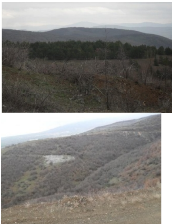
Слика 1: Експлоатационо поле на Каменолом Оризари

Реката Липковска, Липковското Езеро и Слупчанска Река се наоѓаат на оддалеченост од околу 2 km од концесискиот простор (воздушна линија).