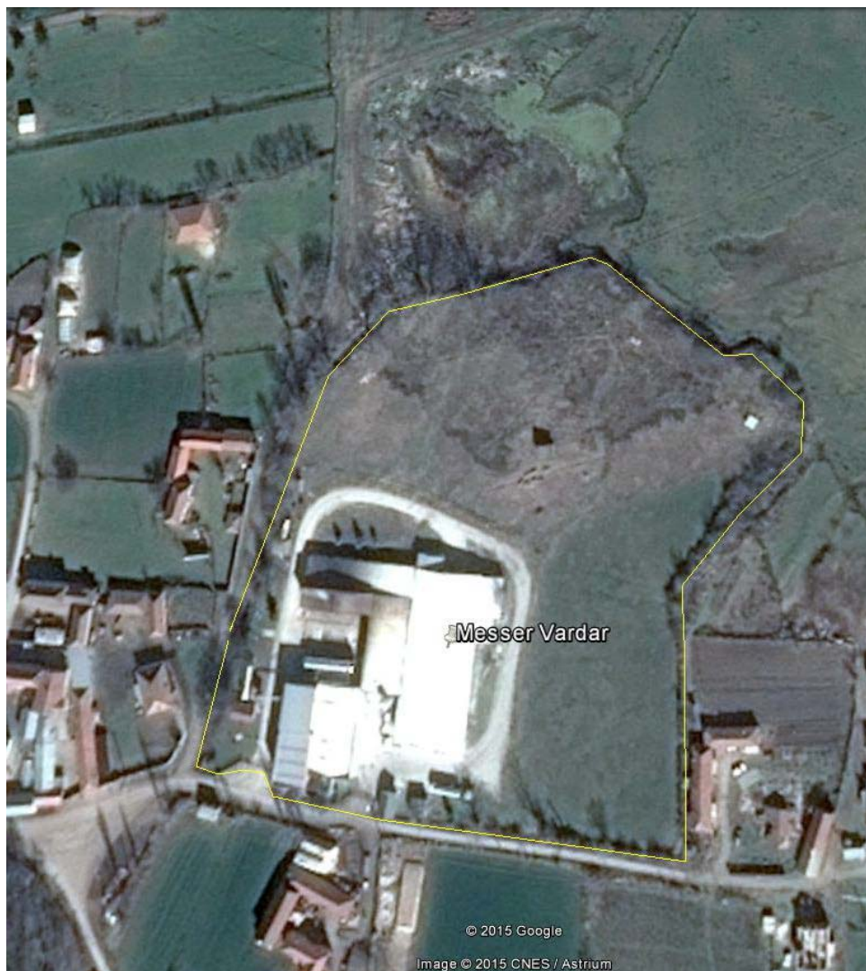
Слика 2. Мапа на локацијата со географска положба и јасно назначени граници на инсталацијата

1.1.3 Инсталацијата ќе работи, ќе се контролира, ќе одржува и емисиите ќе бидат такви како што е наведено во оваа Дозвола. Сите програми кои треба да се изготват според условите во оваа Дозвола стануваат дел од Дозволата.