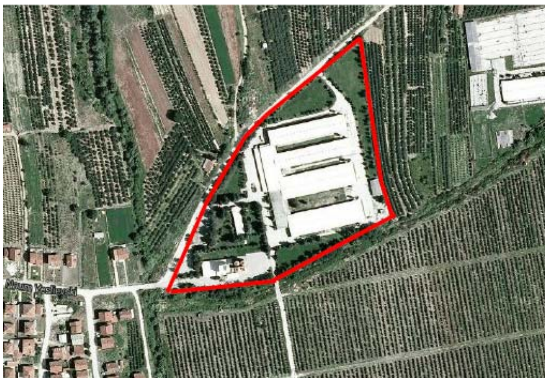
Местоположба на инсталацијата