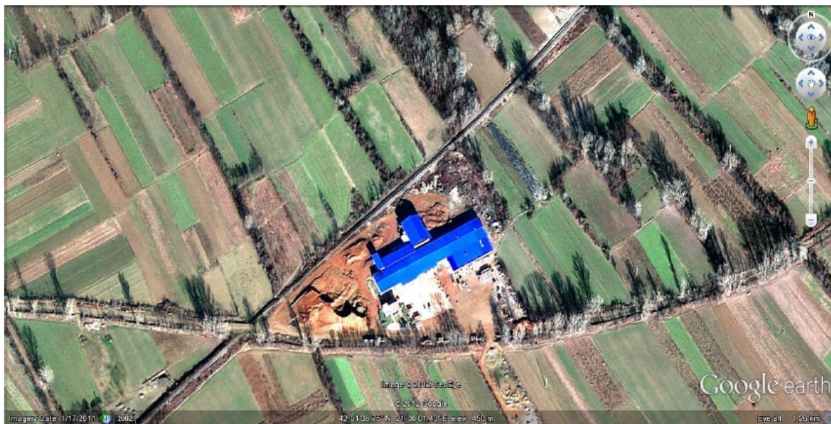
Слика 1. Мапа на инсталацијата