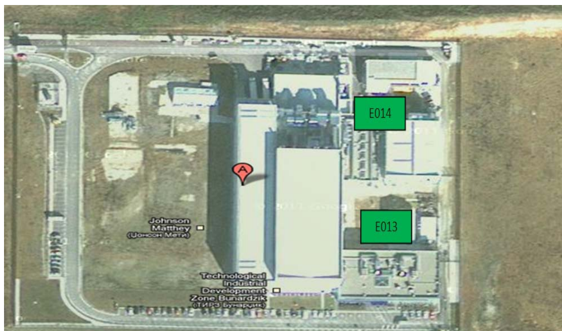
Слика: Шематски приказ на изворите на бучава од страна на инсталацијата за производство на катализатори Џонсон Мети Скопје