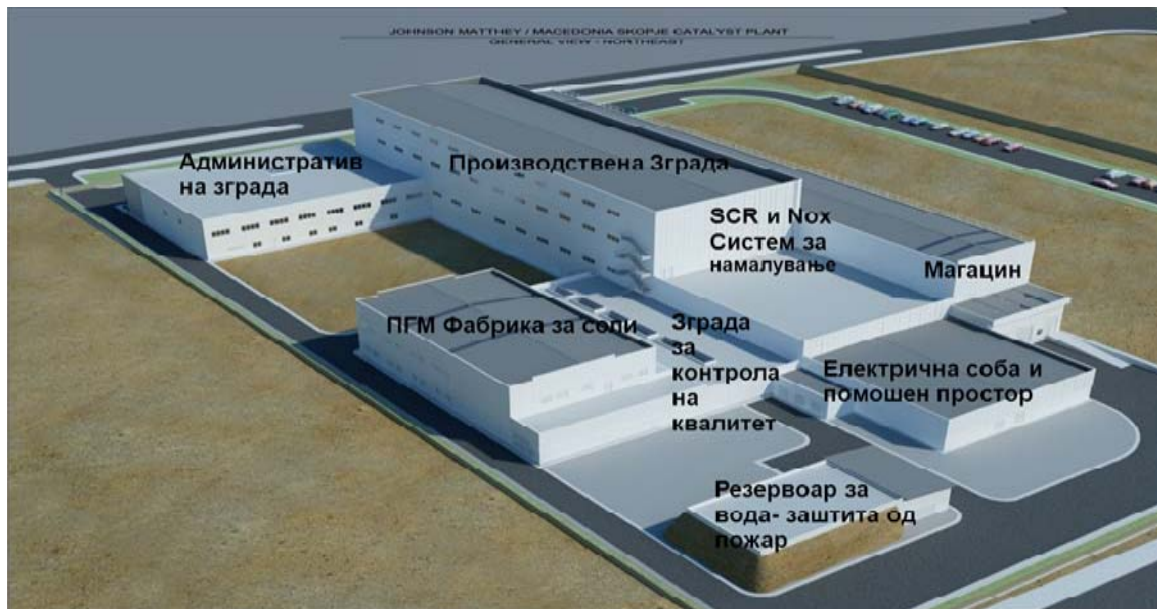
Слика: Тродимензионален приказ на областите во Џонсон Мети во Македонија

5) лаборатории за контрола на квалитетот.