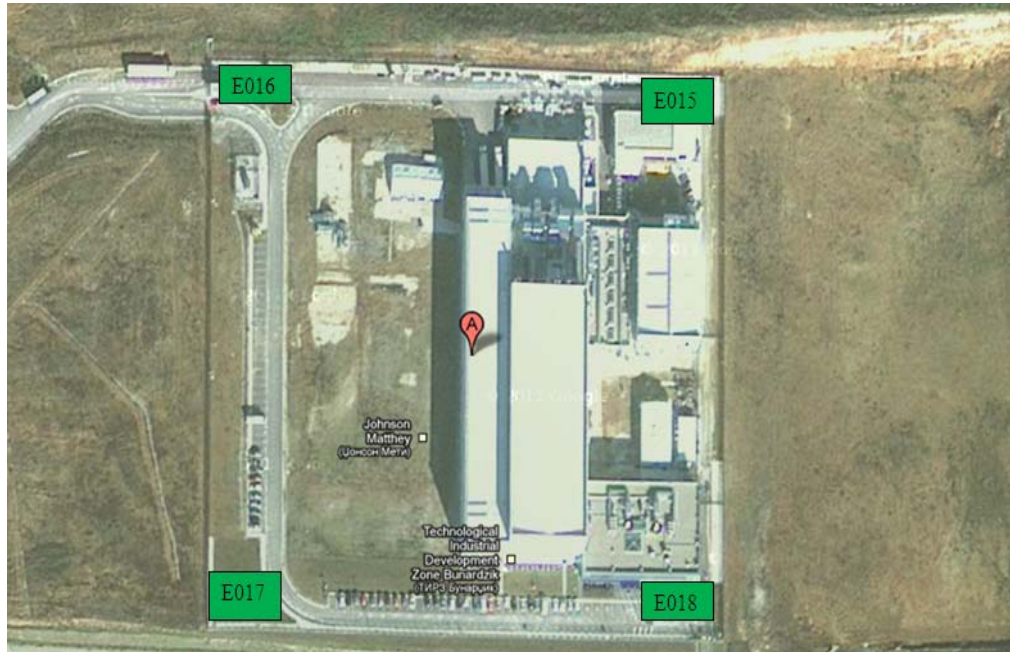
Слика: Шематски приказ на мерните места за мерење на амбиентална бучава од страна на инсталацијата за производство на катализатори Џонсон Мети Скопје