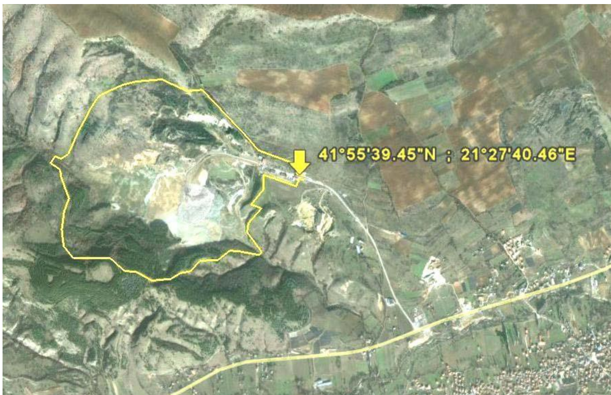
Слика бр. I-1 Локација на Депонијата Дрисла со обележени граници координати на влезот

А-интегрирана дозвола за усогласување со оперативен план : Закон за животна средина Инсталација за која се издава дозволата : Друштво за депонирање на комунален отпад Дрисла – Скопје ДОО, Батинци, Студеничани