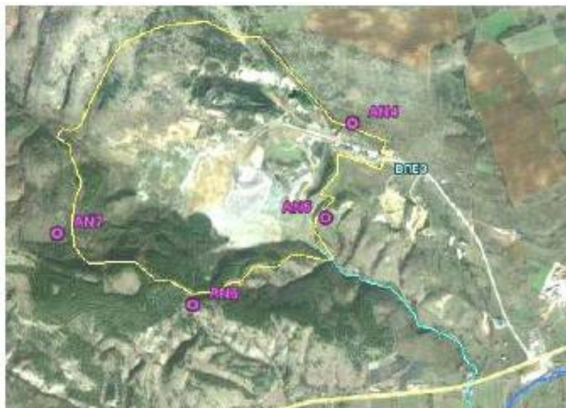
Мерни места на извршени снимања за бучава