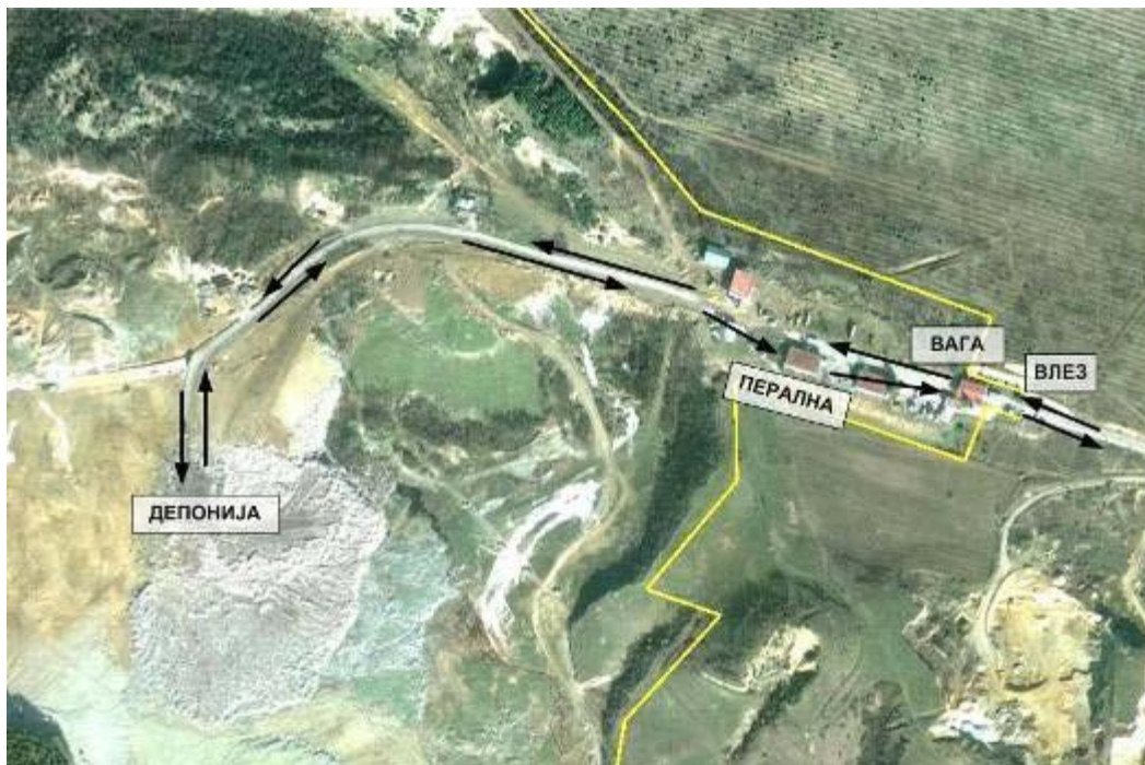
Патека на движење на возилата со комунален отпад

А-интегрирана дозвола за усогласување со оперативен план : Закон за животна средина Инсталација за која се издава дозволата : Друштво за депонирање на комунален отпад Дрисла – Скопје ДОО, Батинци, Студеничани