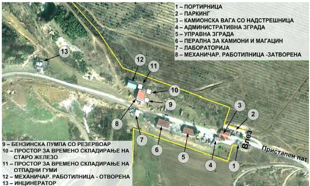
Слика бр. II-3 Ситуација на објектите во рамките на депонијата Дрисла