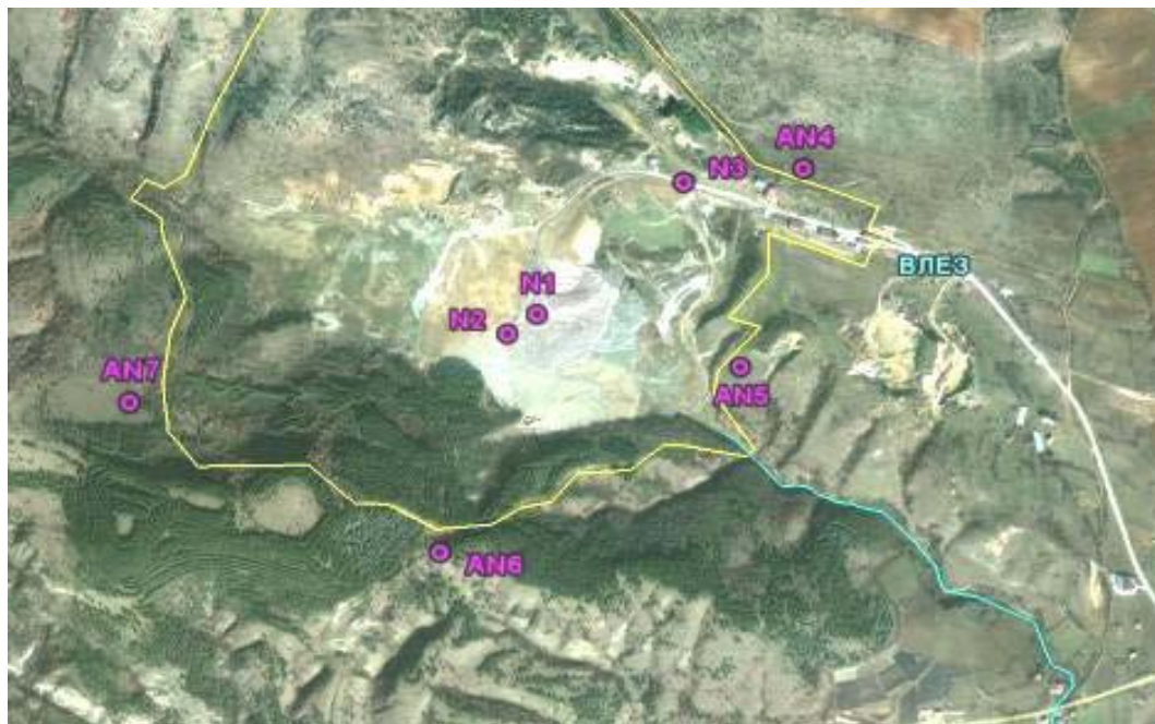
Мерни места каде што се извршени снимања