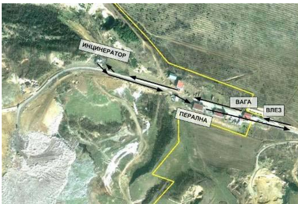
Патека на движење на возилата со медицински отпад