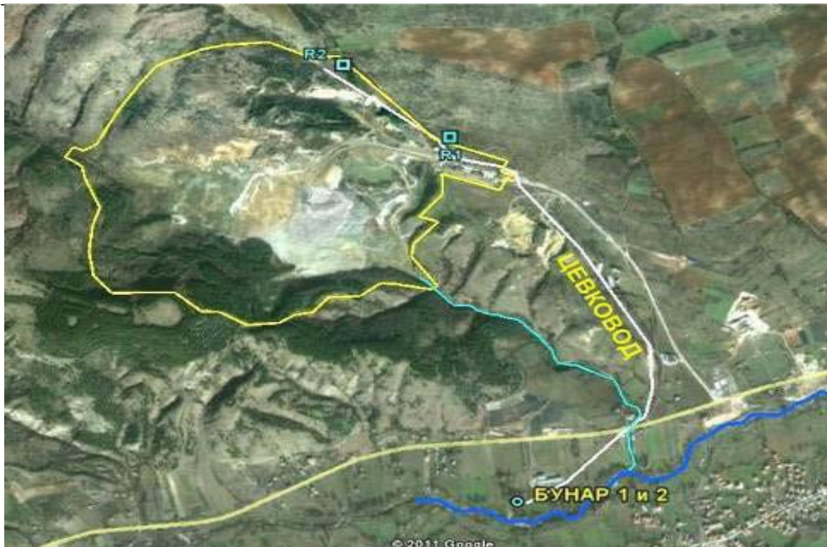
Цевковод за напојна вода од Бунари 1 и 2 до резервоарите R1 и R2