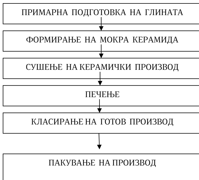
Слика бр. 2 Постапка за добивање керамички производ