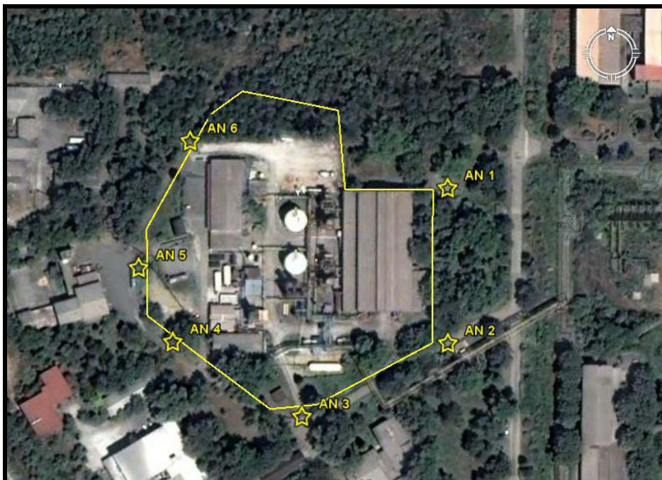
Места на мерење на амбиентална бучава