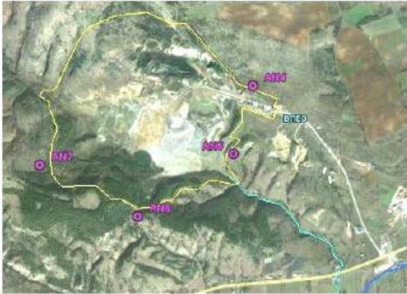
Мерни места на извршени снимања за бучава