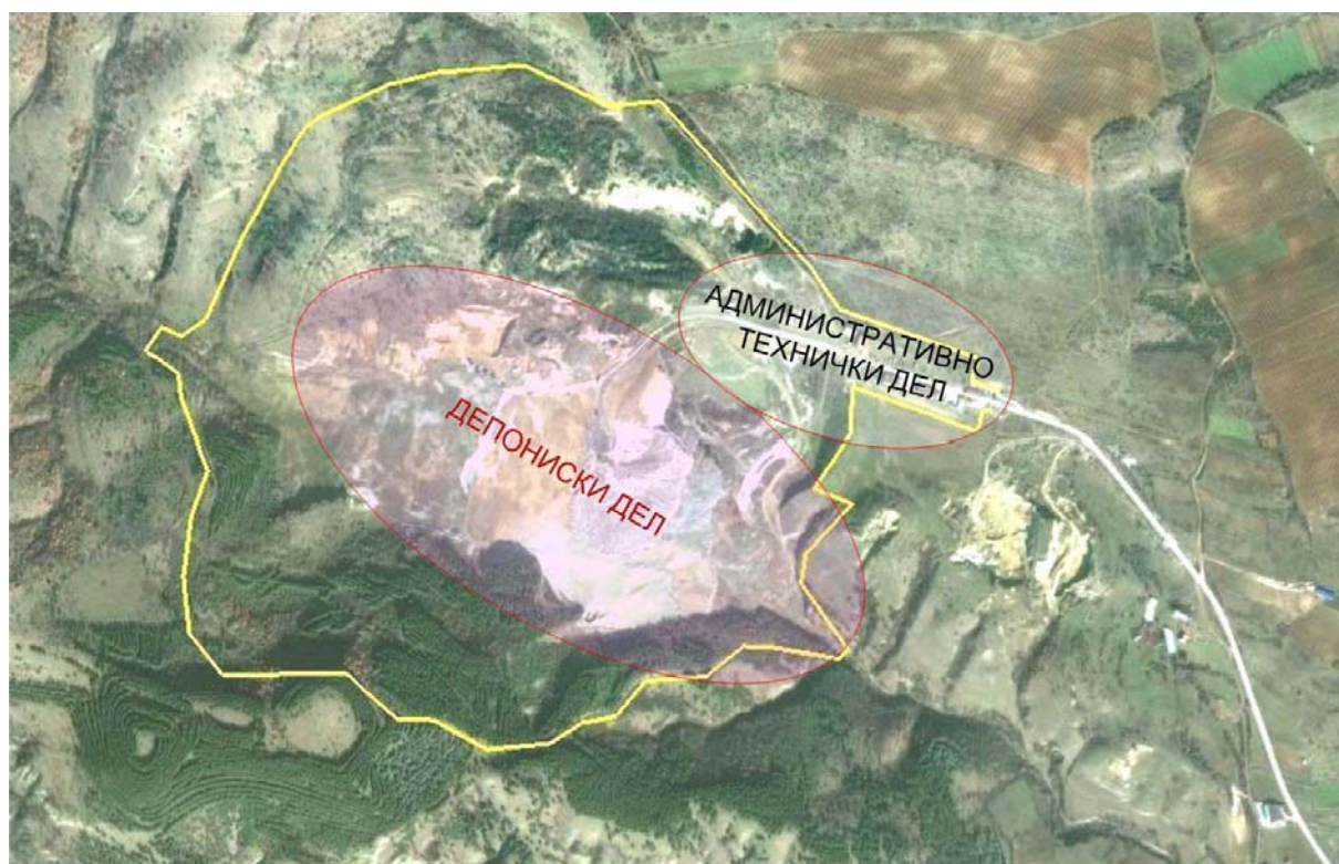
Слика бр. II-2 Дрисла со своите оперативни делови