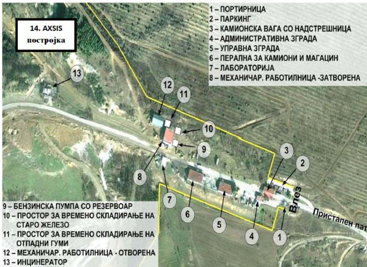
Слика бр. II-3 Ситуација на објектите во рамките на депонијата Дрисла